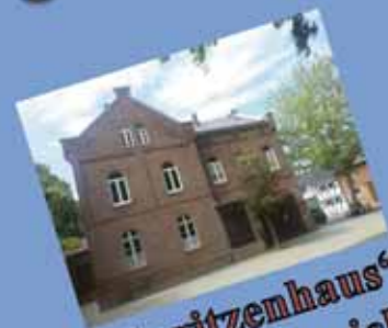
„Spritzenhaus“ in Nemmenich