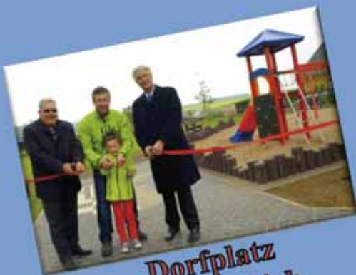
Dorfplatz in Bürvenich