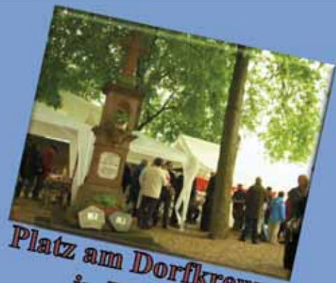
Platz am Dorfkreuz in Hoven

Erste Maßnahmen der Dorferneuerungen fertiggestellt