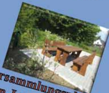
Versammlungsplatz in Juntersdorf

Erste Maßnahmen der Dorferneuerungen fertiggestellt